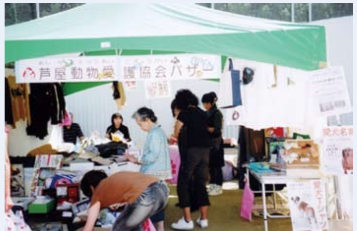
秋まつりでのバザー風景